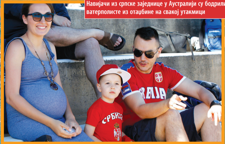
Навијачи из српске заједнице у Аустралији су бодрили ватерполисте из отаџбине на свакој утакмици

●●● Ватерполисти београдског Партизана рођени 2000. године освојили златну медаљу у јуниорској а Б репрезентација Србије сребрну медаљу у сениорској конкуренцији